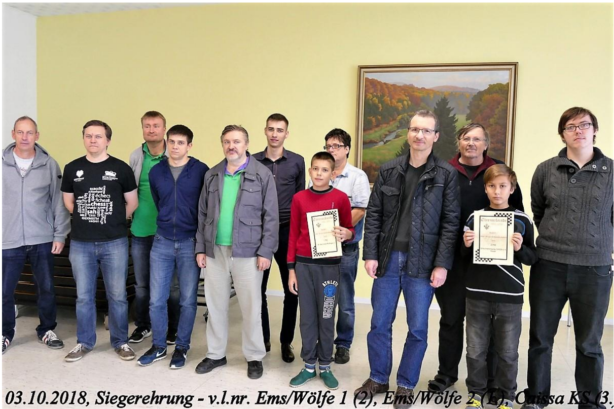
03.10.2018, Siegerehrung - v.l.nr. Ems/Wölfe 1 (2), Ems/Wölfe 2 (1), Quissa KS (3).

Die Sfr. Bad Emstal/Wolfhagen haben sich für Hessischen Blitz – Mannschaftsmeisterschaften 2019 qualifiziert.