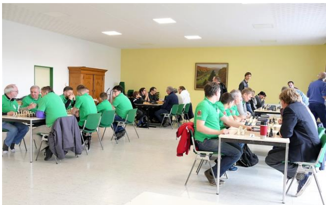
03.10.2018, Blick in den Turniersaal kurz vor dem Start zur 4er Mannschaftsblitzm.