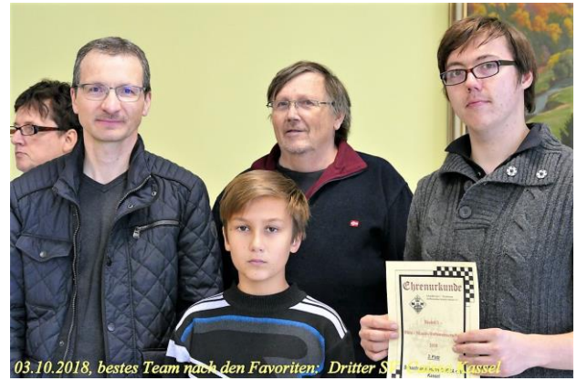
03.10.2018, bestes Team nach den Favoriten: Dritter S