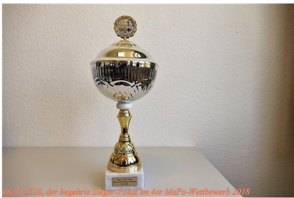
06.05.2018, der begehrte Sieger-Pokal im 4er MaPo-Wettbewerb 2018